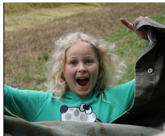
Beruf: Schülerin an der KMSU Pfadihighlight: die gemeinsamen Abende auf dem Haik im SoLa